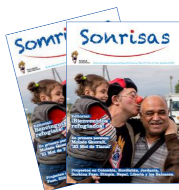
Revista núm. 9