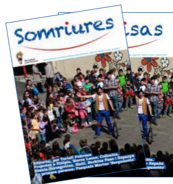
Revista núm. 8

15.639 sessions a la nostra web i 62.043 visites a pàgines.